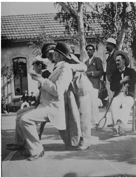
Courts de ténis do Sporting Club de Cascais, c. 1900 Veja as imagens esquerda e direita no Flickr