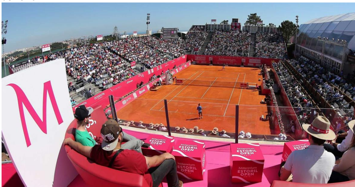
Millennium Estoril Open, 2017

A viragem do século coincidiu com uma série de mudanças de hábitos, conduzindo à procura de novos espaços para a prática do desporto, nomeadamente do ténis. A Câmara Municipal de Cascais colaborou, assim, na construção de campos cobertos no Clube de Ténis do Estoril, no Carcavelos Ténis e no Clube Nacional de Ginástica, apoiando igualmente um conjunto de iniciativas no Centro Recreativo e Cultural da Quinta dos Lombos, como o Circuito CIMA, em parceria com a Federação Portuguesa de Ténis.