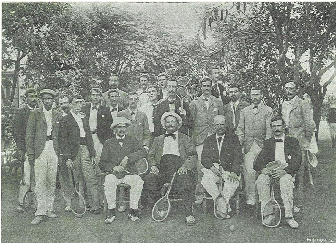
Grupo de tenistas em Cascais, 1899. Ao centro, destaca-se o rei D. Carlos Veja a imagem no Flickr

Apesar da relevância de que se reveste para a modalidade a Quinta Nova de Santo António, em Carcavelos, onde desde 1872 se fixou uma ativa comunidade britânica para assegurar a montagem e gestão das comunicações telegráficas por cabo submarino, que aí instalou campos desportivos, nomeadamente de ténis, cedo o Sporting Club de Cascais, sociedade desportiva e recreativa fundada em 1879, se assumiu como o berço da modalidade em Portugal.