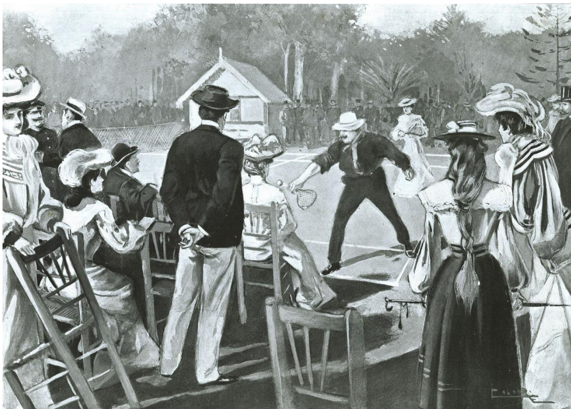
D. Carlos praticando ténis no Sporting Club de Cascais, 1903 Veja a imagem no Flickr