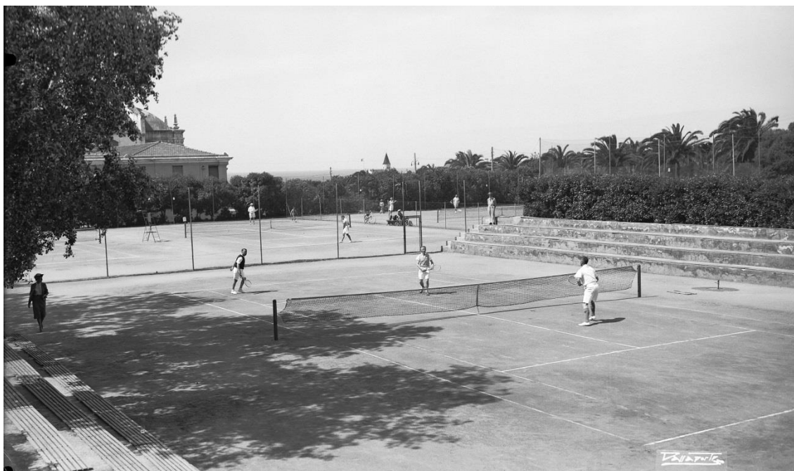
Clube de Ténis do Estoril, c. 1950 Veja a imagem no Flickr

A excelente localização do Clube de Ténis do Estoril, junto ao Casino, tornou-o no local privilegiado para receber as grandes competições internacionais. A primeira vitória de Portugal na Taça Davis, em 1963, frente ao Luxemburgo, foi, assim, alcançada neste clube. Nesse mesmo ano, Alfredo Vaz Pinto também conquistaria no Estoril o primeiro dos seus 7 títulos de campeão nacional. Até à mudança das instalações, em 1991, o Clube de Ténis do Estoril manter-se-ia como a sala de visitas do ténis português. Aí se disputariam todos os anos torneios internacionais para os mais jovens, acolhendo-se, ainda, a elite mundial, durante uma semana, no verão, para os Campeonatos Internacionais, que contaram com a participação de jogadores como Manuel Santana, Juan Couder ou François Jauffret.