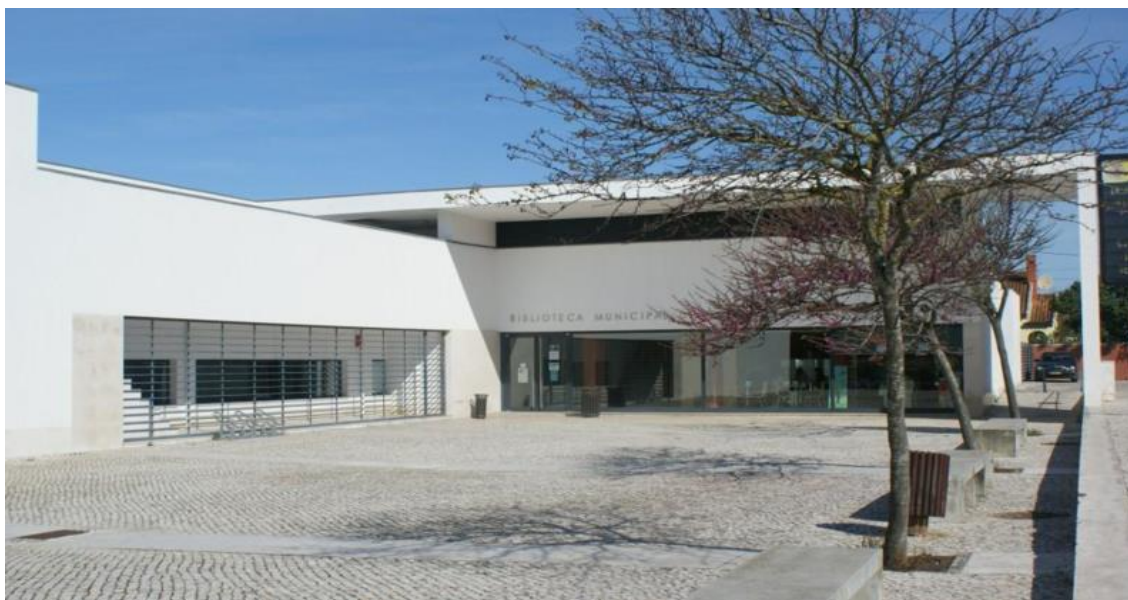
Biblioteca Municipal de S. Domingos de Rana Veja a imagem no Flickr

A Biblioteca Municipal de S. Domingos de Rana , em Massapés (Tires), junto ao Complexo Polidesportivo de S. Domingos de Rana e à Escola Secundária Frei Gonçalo de Azevedo, funciona num edifício da autoria do arquiteto João Lucas Dias, inaugurado a 23 de abril de 2005.