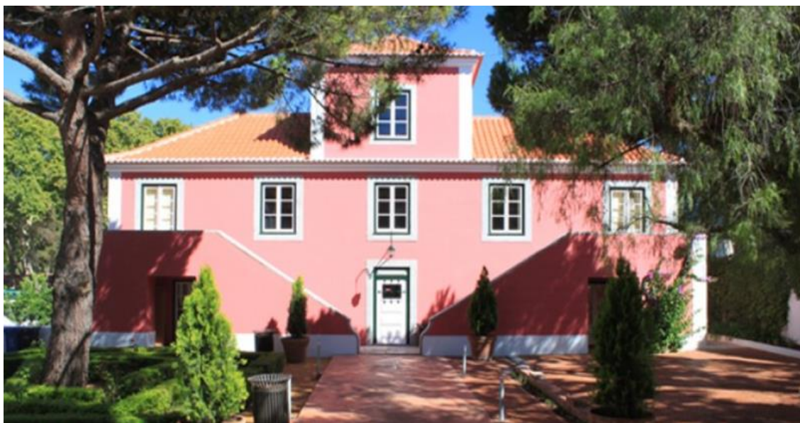
Biblioteca Municipal de Cascais – Casa da Horta da Quinta de Santa Clara Veja a imagem no Flickr

A Biblioteca Municipal de S. Domingos de Rana , em Massapés (Tires), junto ao Complexo Polidesportivo de S. Domingos de Rana e à Escola Secundária Frei Gonçalo de Azevedo, funciona num edifício da autoria do arquiteto João Lucas Dias, inaugurado a 23 de abril de 2005.