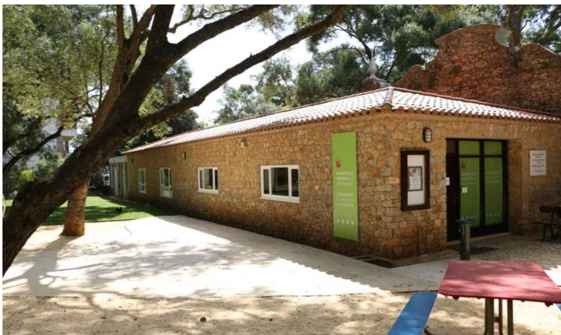
Biblioteca Infantil e Juvenil de Cascais Veja a imagem no Flickr

A Biblioteca Infantil e Juvenil , em atividade desde 1971, foi criada no Museu-Biblioteca Condes de Castro Guimarães, transitando, depois, para as atuais instalações, no Parque Marechal Carmona, que em breve serão totalmente remodeladas. Integrou a Rede de Bibliotecas Fixas da Fundação Calouste Gulbenkian até 2003, ano em que passou a ser gerida pela Câmara Municipal de Cascais.