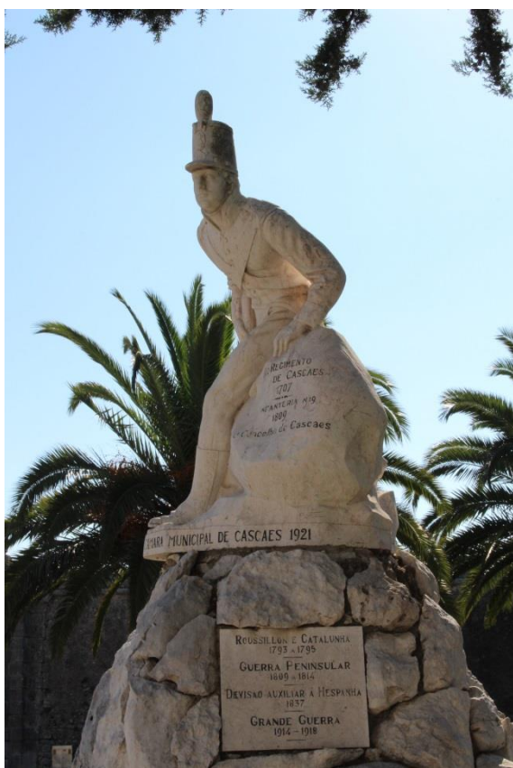
Monumento ao Regimento de Infantaria 19, em Cascais Ver imagem no Flickr

Aquartelado na Cidadela de Cascais de 1707 a 1834, o Regimento de Infantaria de Cascais ficou célebre pelas várias campanhas militares em que participou, das quais se destacam a Campanha do Rossilhão (1793-1795) e a Guerra Peninsular (1807-1814), nesta última já com a designação de Regimento de Infantaria 19, fruto das reestruturações ocorridas em 1806. O regimento viria a ser extinto pelo então governador-geral de Portugal, Jean-Andoche Junot, a 22 de dezembro de 1807, sendo reorganizado após a Convenção de Sintra, a 30 de agosto de 1808. Proclamou o seu apoio a causa legitimista de D. Miguel, comparecendo em formatura no Terreiro do Paço a 25 de março de 1828. Acabaria por ser dissolvido definitivamente no dia 26 de maio de 1834 pela Convenção de Évora Monte. Até 1945, o feriado municipal de Cascais era comemorado a 30 de agosto, data que evocava o regresso apoteótico do Regimento à vila, em 1814. Curiosamente, sempre que participava em alguma campanha militar, fazia-se acompanhar da imagem de Santo António, que ainda hoje é venerado em Cascais.