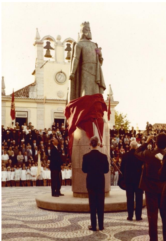
Inauguração da Estátua de D. Pedro I, em Cascais, 1965 Ver imagem no Flickr

atribuição da carta de vila, a Câmara Municipal promoveu uma ação de conservação e restauro da estátua.