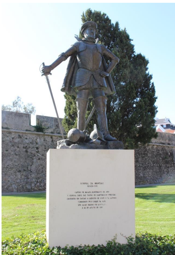
Estátua de D. Diogo de Meneses, em Cascais Ver imagem no Flickr

mais de 4 000 homens que se aquartelaram na Torre de Cascais, estrutura que seria posteriormente agregada à Fortaleza de Nossa Senhora da Luz. No entanto, face à supremacia das forças espanholas, acabaria por ser aprisionado e decapitado na referida torre a 2 de agosto de 1580.