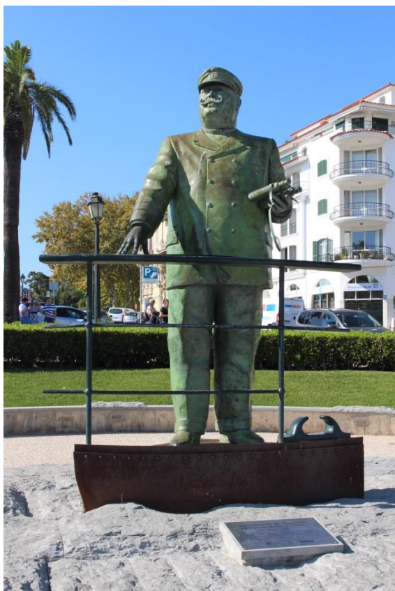
Estátua de D. Carlos, em Cascais

Em 2007 a Academia de Letras e Artes propôs à Câmara Municipal de Cascais a conceção de uma estátua do rei D. Carlos, que seria inaugurada um ano depois, aquando do centenário da sua morte. Da autoria do escultor Luís Valadares, conhecido pelos seus trabalhos de grande dimensão e em estilo realista, o monumento em bronze seria edificado junto à Cidadela, onde o monarca viveu e criou o primeiro laboratório nacional de biologia marítima.