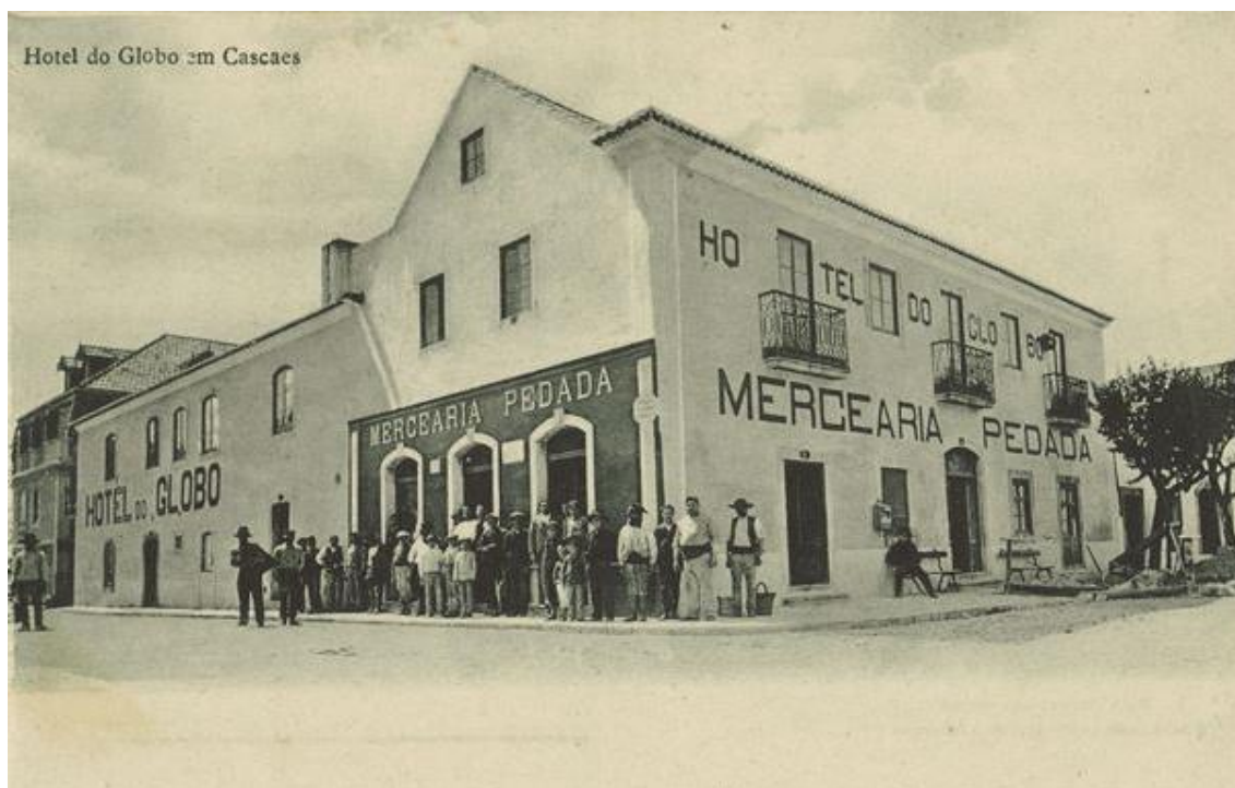
Hotel do Globo, em Cascais, c. 1900

Também o projeto de urbanização do Monte Estoril, conduzido pela Companhia Monte Estoril a partir de 1888 – que impôs a localidade enquanto centro de vilegiatura especialmente frequentado pela aristocracia e burguesia abastada, em muito devido à instalação, em 1893, da Rainha D. Maria Pia num dos chalets da localidade – beneficiou da construção dos moderníssimos Grand Hotel e Grand Hotel d’Italie, inaugurados na Avenida Saboia, em 1898 e 1899, respetivamente, com o apoio do Casino do Monte Estoril e do Casino Internacional, já então em atividade. No ano de 1906 inaugurar-se-ia um terceiro equipamento na localidade: o Royal Hotel, que em 1914 deu lugar ao Hotel Miramar.