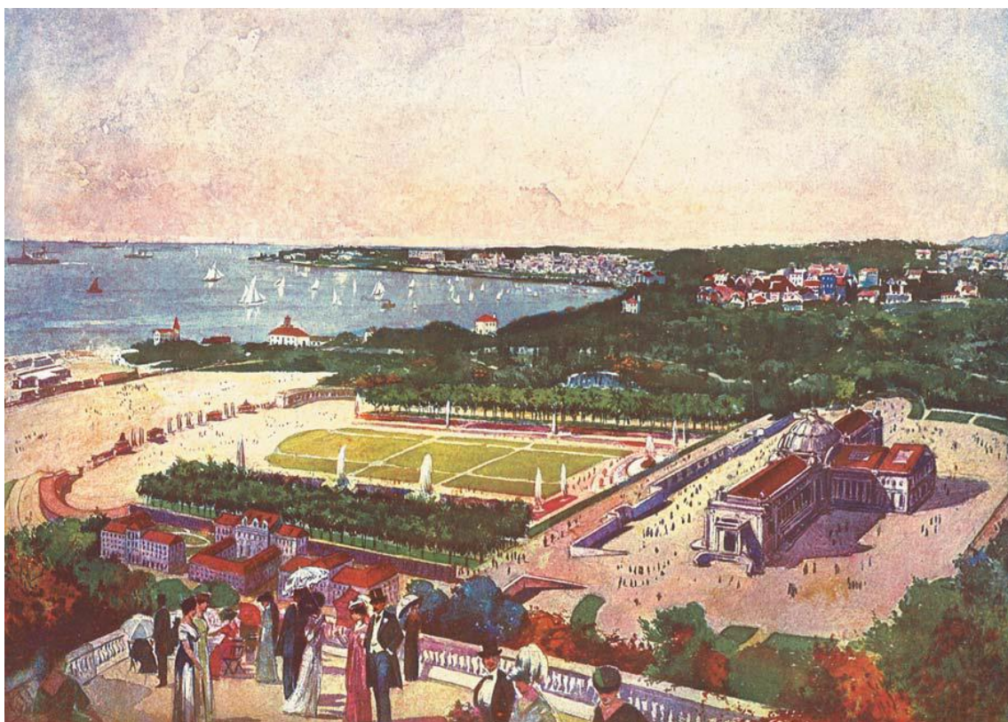
Projeção do novo Estoril, 1914