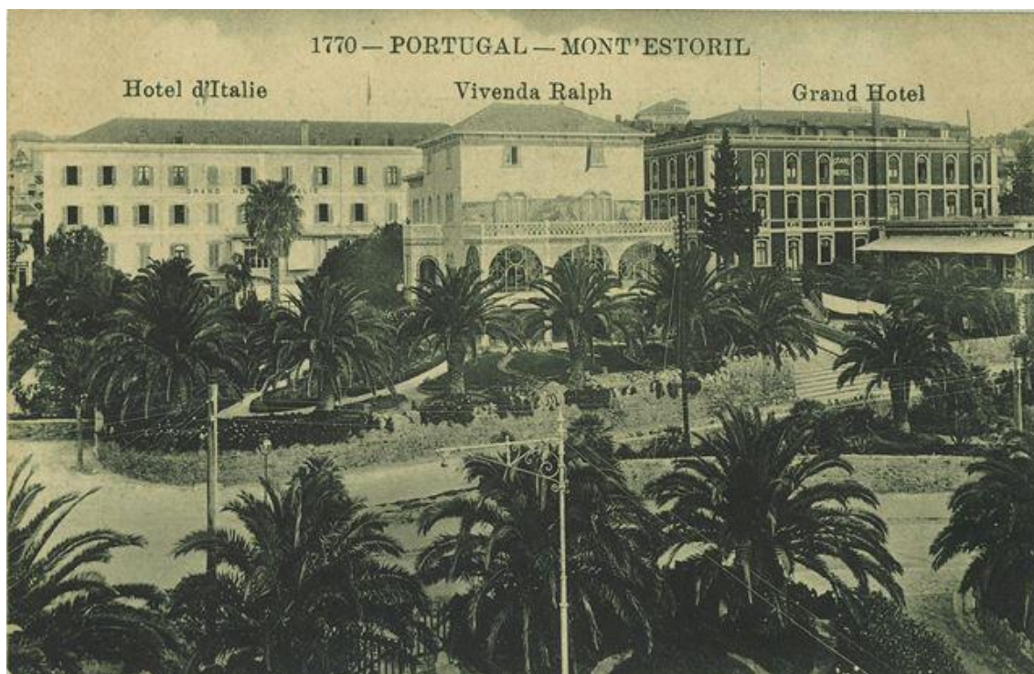
Grande Hotel de Itália e Grande Hotel Estrade, no Monte Estoril, c. 1900 Veja a imagem no Flickr

Estas unidades refletiam já a profissionalização da indústria do lazer, estimulada pela legalização do jogo no Estoril, em 1927, pela existência de novos e diversificados públicos-alvo e pela criação de entidades oficiais vocacionadas para o turismo, como é o caso da Comissão de Iniciativa e Turismo, que viria a ser sucedida pela Junta de Turismo de Cascais, em 1937.