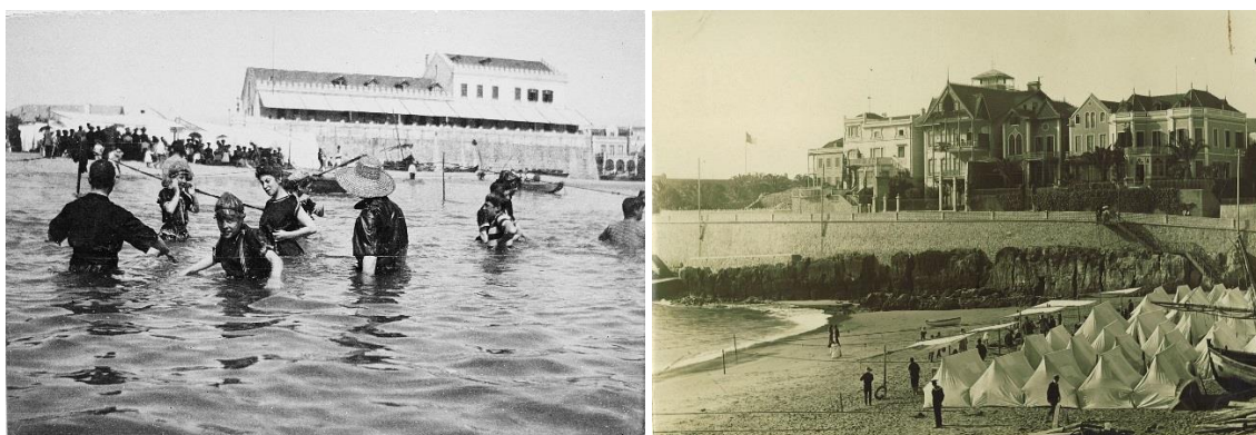
Banhistas em Cascais, c. 1900

Em 1867, quando a Rainha D. Maria Pia escolheu Cascais para a prática dos banhos de mar, a vila ascenderia à condição de praia da Corte, numa estada sazonal que se consolidou a partir de 1870, aquando da conversão da antiga casa do Governador da Cidadela no modesto Paço Real de Cascais. D. Carlos manteria a tradição da passagem da Família Real por Cascais, que graças à modernização promovida entre 1890 e 1908 pelo Presidente da Câmara Municipal, Jaime Artur da Costa Pinto, se impôs como a capital do lazer e do desporto em Portugal no período do ano consagrado aos banhos de mar.