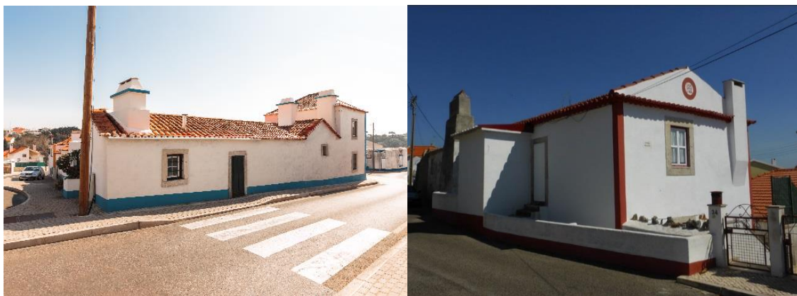
Casais saloios em Manique de Baixo e Tires Ver imagem esquerda e imagem direita no Flickr

Considera-se arquitetura vernacular todo o tipo de construção em que se utilizam materiais e recursos do próprio ambiente em que o edifício é erigido. Os modelos construtivos mais representativos deste tipo de arquitetura popular são as casas térreas, as casas torreadas e as casas de dois pisos, a que se associam os casais saloios, que, para além da área de cultivo, dispõem de uma habitação com um ou dois andares. Todos contavam também com um pátio ou logradouro, onde se localizavam os armazéns, os palheiros e as arribanas ou currais.