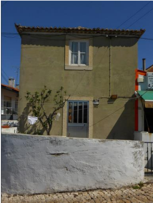
Casa torreada em Tires Ver imagem no Flickr

A disposição das áreas internas caracteriza-se pela simplicidade, traduzindo-se numa independência total do quarto, que ocupava todo o primeiro piso, face às restantes divisões, localizadas no rés-do-chão, onde se situava o armazém e a sala de entrada. Dispõe igualmente de um corpo anexo com telhado de duas águas, onde se localizava a cozinha, com forno, bem como de um pátio de acesso às arribanas e hortas. Por vezes apresenta, ainda, portais com motivos decorativos.