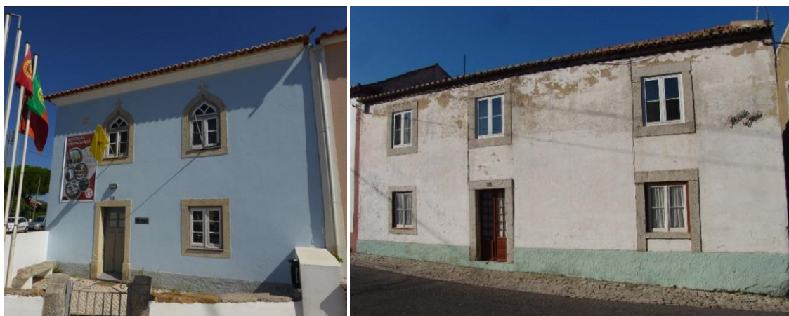
Casas de dois pisos em Tires e Alcabideche Ver imagem esquerda e imagem direita no Flickr

A brancura da casa caiada era quase sempre animada por uma barra de cor no soco, sendo que algumas habitações de maiores dimensões, decerto de proprietários mais abastados, possuem elementos decorativos adicionais, nomeadamente ao nível dos vãos e chaminés.