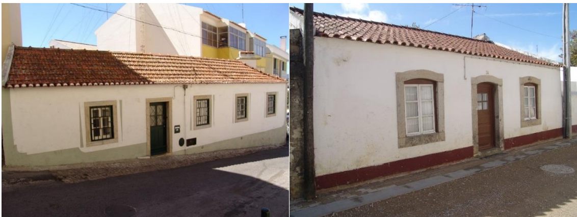
Casas de piso térreo em Manique de Baixo e no Murtal Ver imagem esquerda e imagem direita no Flickr

Geralmente de planta retangular, dispõe de telhado de duas águas com beirado simples. Os fornos, situados na cozinha – considerada a zona mais importante da casa – são, muitas vezes, perceptíveis pela sua saliência face ao alinhamento da planta, localizando-se, normalmente, nas suas traseiras.