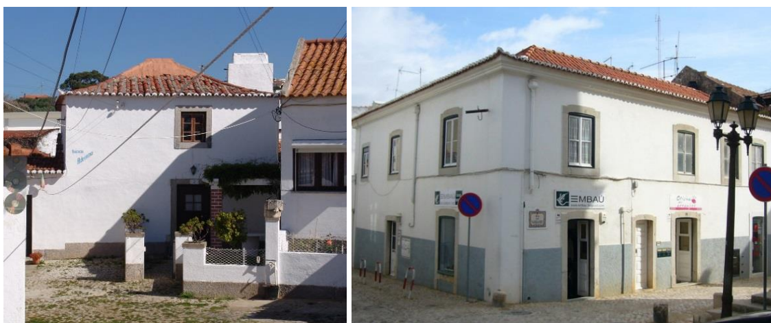
Casas de dois pisos em Alvide e Cascais Ver imagem esquerda e imagem direita no Flickr

Já nas casas de dois pisos totalmente destinadas a habitação, no piso térreo encontram-se a cozinha e a sala, sendo os quartos instalados no primeiro andar, ao qual se acede por meio de uma escada interior.