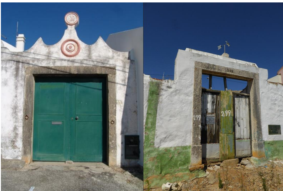
Portais na Charneca e em Tires Ver imagem esquerda e imagem direita no Flickr

A disposição das áreas internas caracteriza-se pela simplicidade, traduzindo-se numa independência total do quarto, que ocupava todo o primeiro piso, face às restantes divisões, localizadas no rés-do-chão, onde se situava o armazém e a sala de entrada. Dispõe igualmente de um corpo anexo com telhado de duas águas, onde se localizava a cozinha, com forno, bem como de um pátio de acesso às arribanas e hortas. Por vezes apresenta, ainda, portais com motivos decorativos.