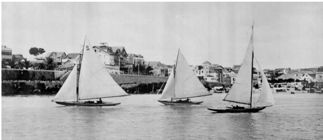
Regata de bulb-keels . Cascais, 1902