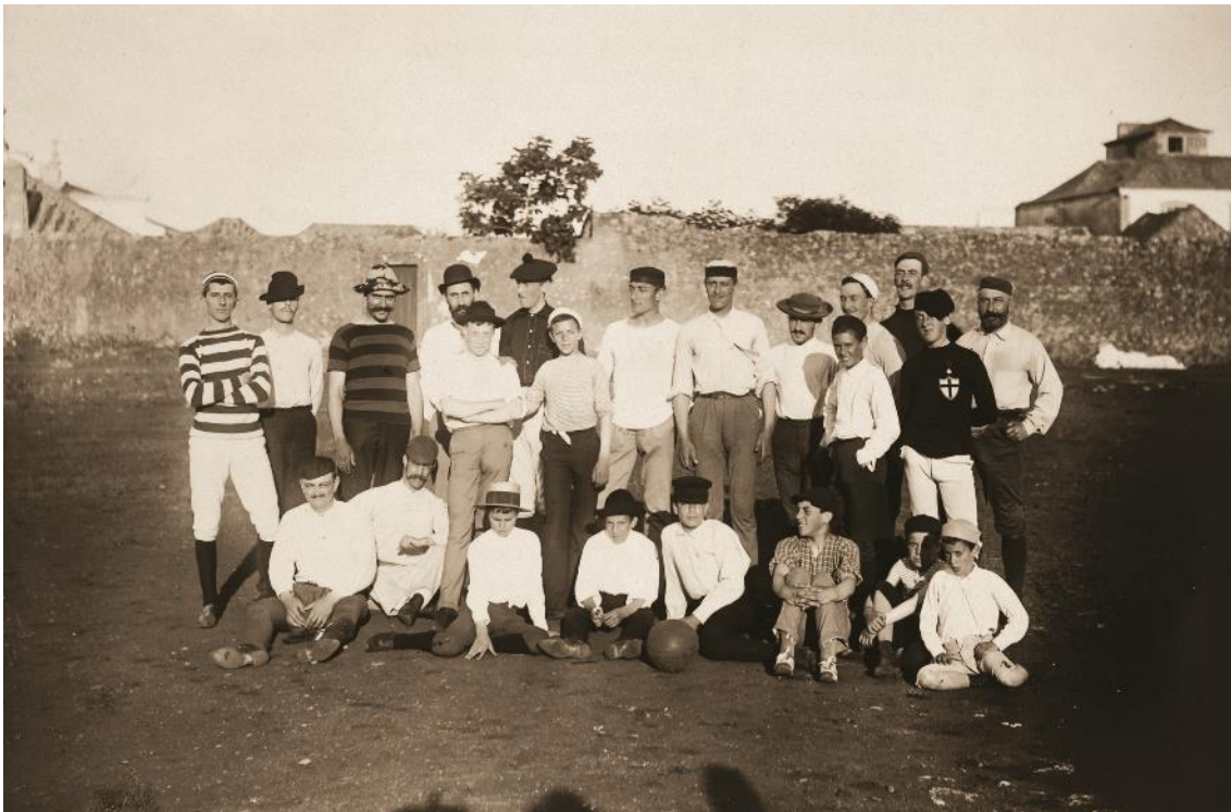
Pioneiros do futebol português. Cascais, 1888

A Guilherme Pinto Basto se deveu igualmente a introdução do futebol em Portugal. Foi em 1888 que decorreu, também na “Parada”, aquela que é considerada a primeira exibição de futebol entre portugueses no nosso país. Apesar de o cavalheirismo que caracterizava os sportsman ter certamente imperado, a inexperiência dos jogadores e a má qualidade do terreno devem ter proporcionado aos assistentes uma competição peculiar... Este desporto popularizar-se-ia rapidamente, assistindo-se à criação de equipas um pouco por todo o concelho, com fortes ligações ao associativismo local, como sucedeu com o Grupo Dramático e Sportivo de Cascais, o Grupo Sportivo de Carcavelos ou o Parede Futebol Clube.