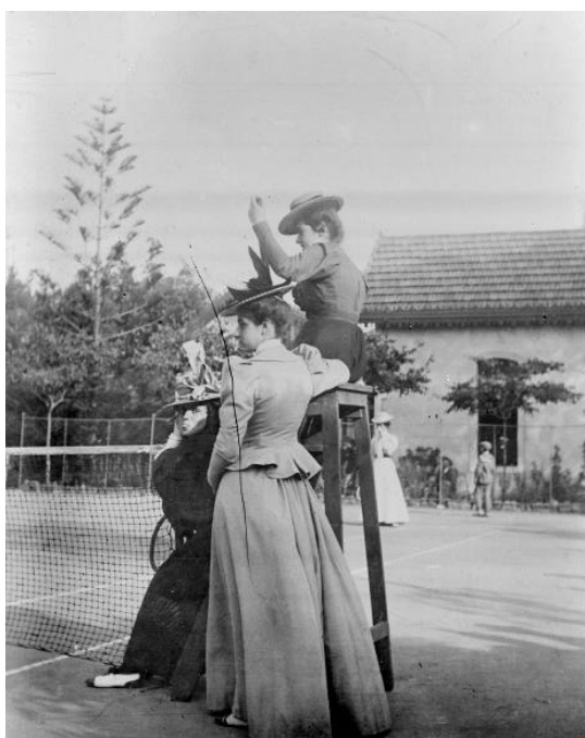
Partida de ténis na Parada, c. 1900