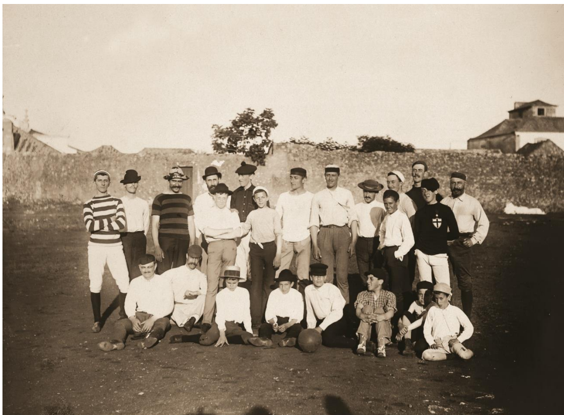
Pioneiros do futebol português, em Cascais, 1888